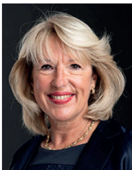
Jaqueline DE QUATTRO Conseillère nationale, avocate